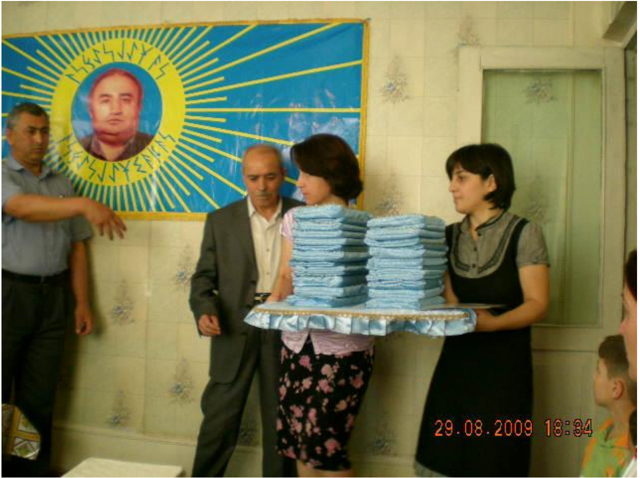
Nurtəkin və Göylü Atalar Qutsal Bitiqləri (Müqəddəs) Kitabları Özlü üzərində Törənə təqdim edirlər.

Soylu Atalı: Nəzərinizə yenə çatdırım. Deməli, Birinci Onluğun Birinci Müqəddəs Kitabı. Biz bunun adına Qutsal Bitiqlər deyirik. On üstəgəl üç. Yəni on əsas, üç yan əlavə Bitiq deyirik. Onluq – Atanın 45 Müqəddəs Kitabıdır. Əyləş, Türkel, əyləş. On Müqəddəs Kitab.