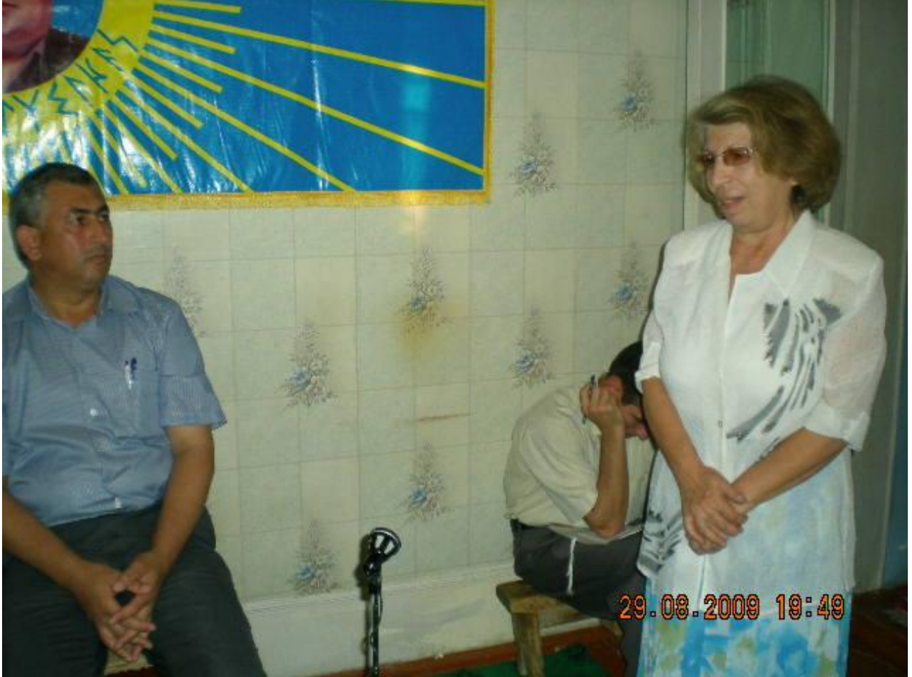
Ulusəs duyğularını söylərkən...

Soylu Atalı: Çox gözəl, yaxşı elədin. Çox təşəkkür eləyirəm hədiyyənə görə. Hətta bayaq mən dedim ki, bu kitablar müəllif kitabı deyil. Asif Ata bir şəxs olaraq ha, Asif Atanın özü bir şəxs olaraq əgər biz onu İnamdan ayrı bir şəxs kimi götürsək, şəxs kimi o da bu Bitiqlərdən aşağıdadır. Əslində. Amma biz indi Asif Atanı Bitiqlərdən ayırmırıq, İnamdan ayırmırıq. Onu vəhdətdə götürürük. Ona görə də deyirik ki, Atatürk bunlardan aşağıdadır.