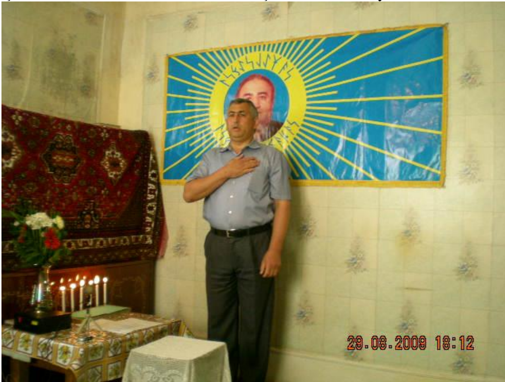
Ocaq Yüklümlüsü Soylu Atalı törənə giriş sözü deyir

Qutsal Bitiqlərimiz hansı ünvana qəbul olunacaqsa, həmin ünvanda törən keçirilir və bu törən də tarixi bir hadisə kimi Ocaq tarixinə yazılır. Sonradan törənin gedişi kitablaşdırılır və evdə, ünvanda Qutsal Bitiqlərin qoyulduğu ən uca ünvanda, daha doğrusu, uca bir yerdə həmin kitab (törənin gedişini əks etdirən kitab) da onların yanına qoyulur. Mən gələcək üçün bəzi məqamları nəzərə almışam. Həm də bəzi gedişlərin qarşısını almaq məqsədilə. Ocaq ənənəsi baxımından Ruhani sənədlər yazmışam. O Ruhani Sənədlər belə bir məqsəd daşıyır. Adətən dünyabaxışlar, əsasən dinlər özlərinin davamıyla, dalınca çox qərribə olaylar nümayiş etdirib. Bu gün də biz onların şahidiyik. Ayrı-ayrı pirlər yaranır, ayrı-ayrı, nə bilim mən, günbəzlər yaranır, ayrı-ayrı sanki Allahın dərgahları yaranır, xüsusi ünvanlar, filan. Halbuki heç bilmirsən o nə deməkdir, orda nə baş verir məlum deyil.